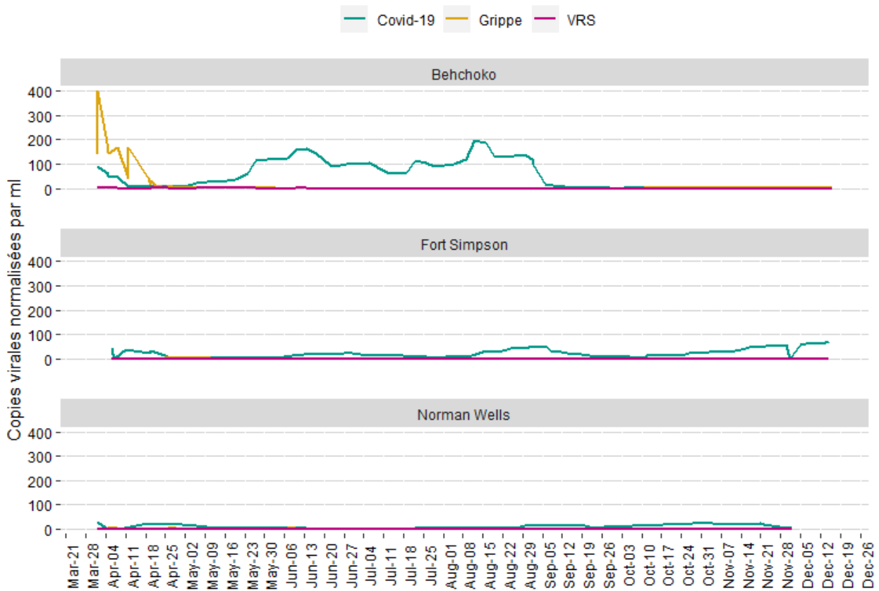
Données agrégées pour le SARS-CoV-2, la grippe et le VRS pour les collectivités de moins de 2 500 habitants

dans les données, une méthode spéciale a été utilisée. 1 Les graphiques suivants ont été divisés en deux groupes, en fonction de la taille de la collectivité. Cela permettra une comparaison plus claire entre les collectivités.